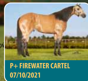
P+ FIREWATER CARTEL 07/10/2021

POTRANCA JÁ DOMADA, POSSUIDORA DE UM PEDIGREE INDISCUTÍVEL, UMA PELAGEM ESTONTEANTE E LEVA UMA PRENHEZ DO FANTÁSTICO FIREWATER CARTEL.