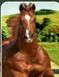
P+ HOLLAND JECK 27/10/2021

DESLUMBREM ESSA POTRANCA. UMA EXCELENTE COMPETIDORA, COM UMA PELAGEM LINDÍSSIMA E AINDA LEVA NO SEU VENTRE NADA MAIS, NADA MENOS QUE UMA PRENHEZ DO FANTÁSTICO HOLLAND JECK.